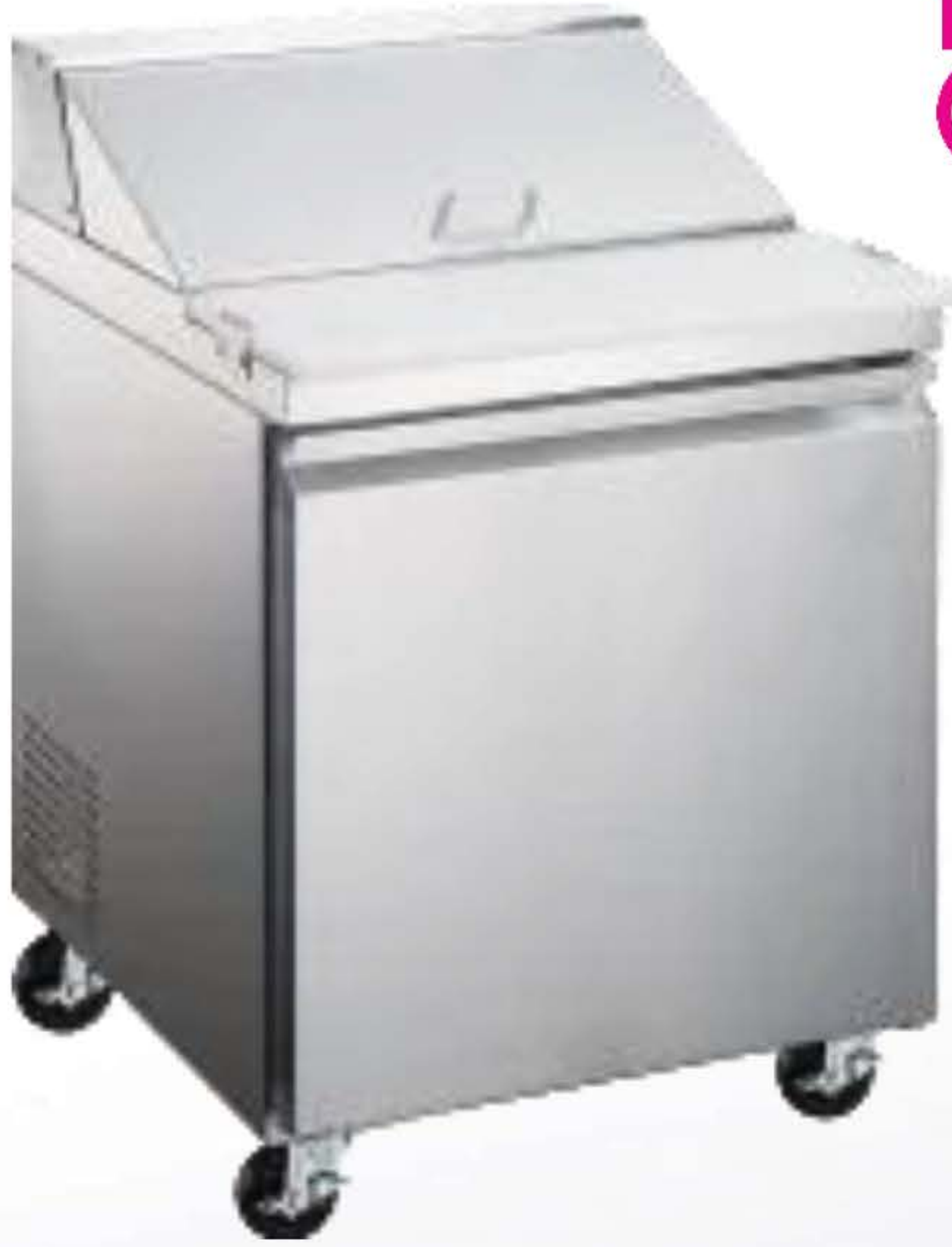
MTRS-27AI1P (8 Y 12 PANS)