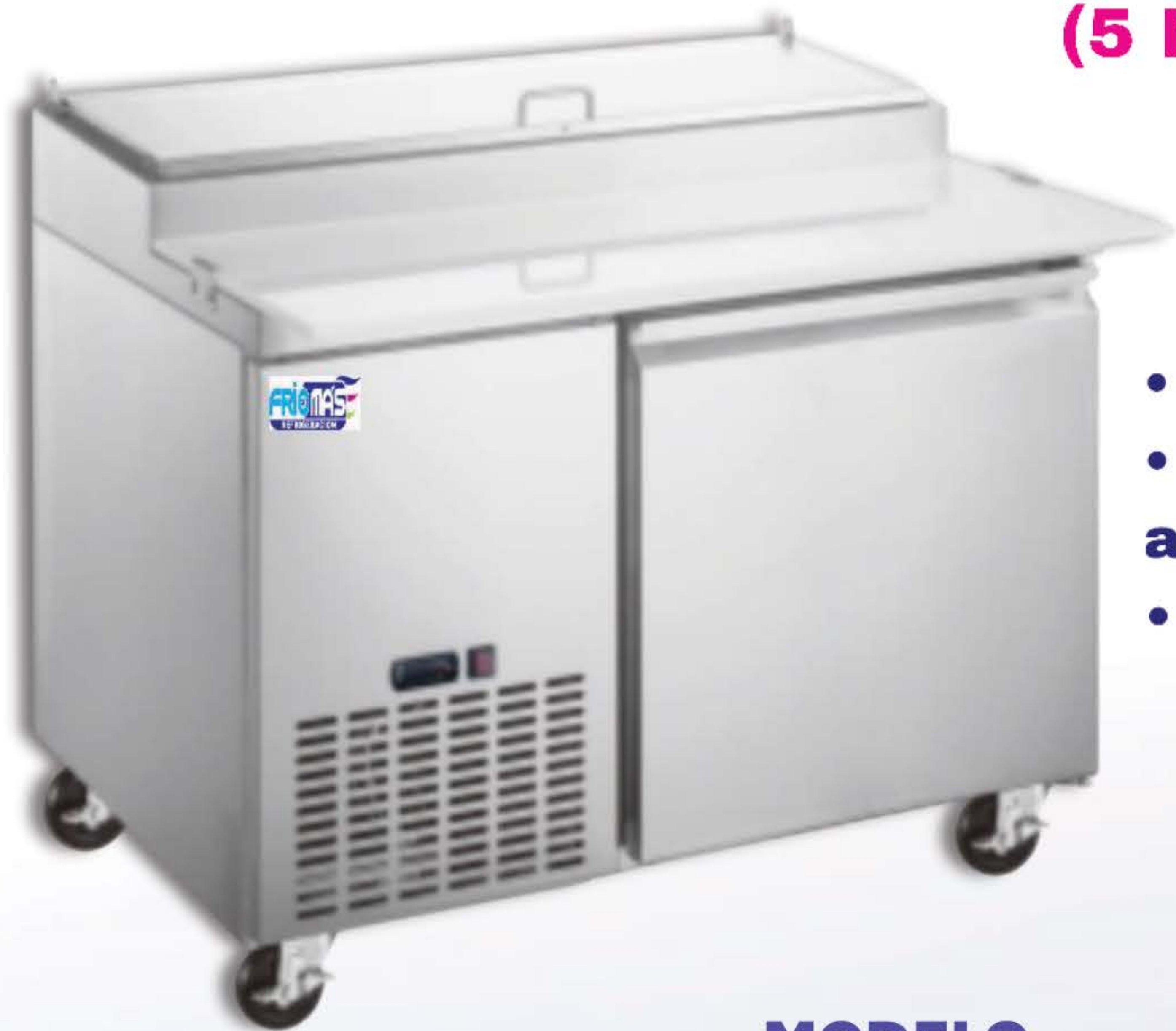
MTRP-44AI1P (5 PANS)