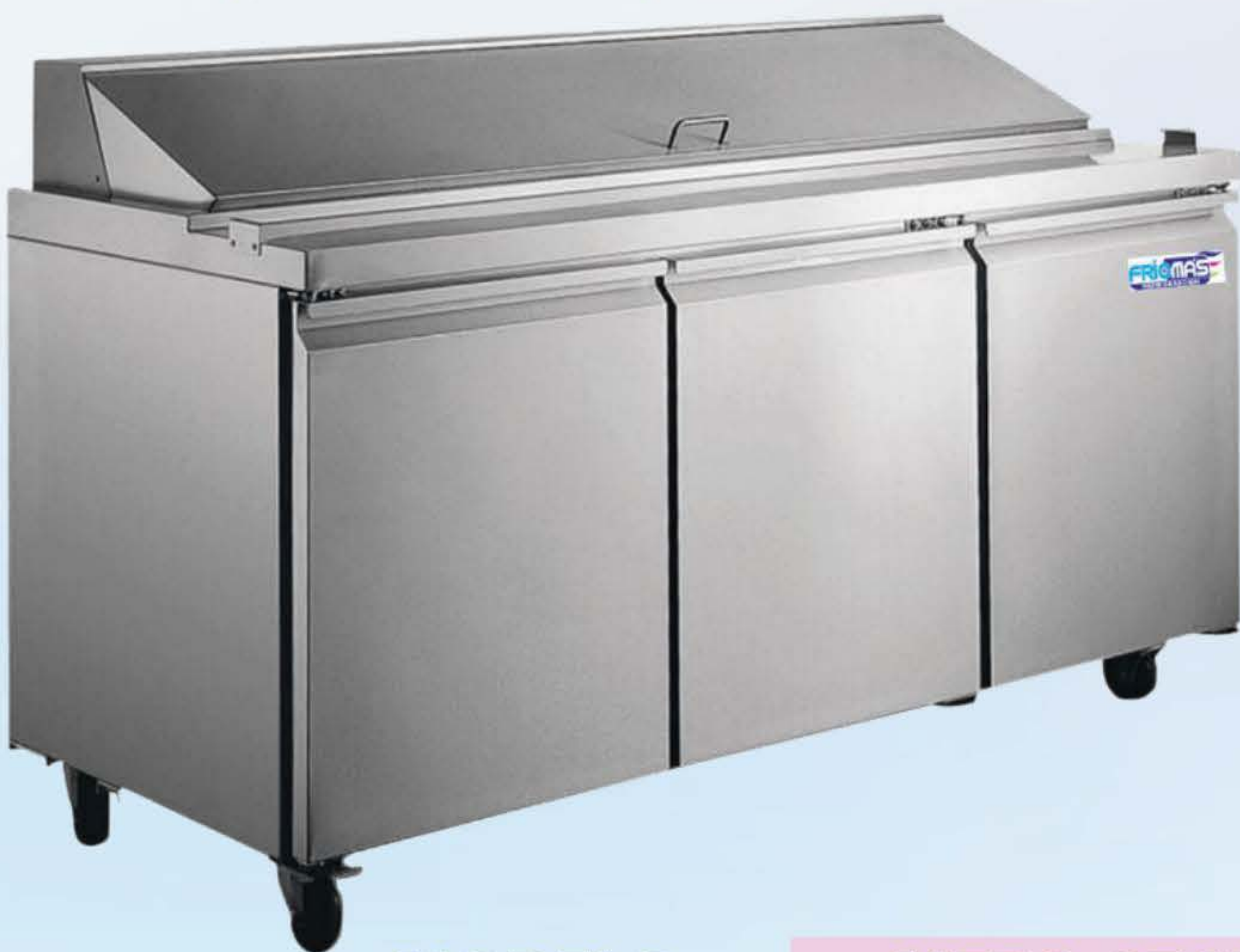
MTRS-72AI3P (30 PANS)