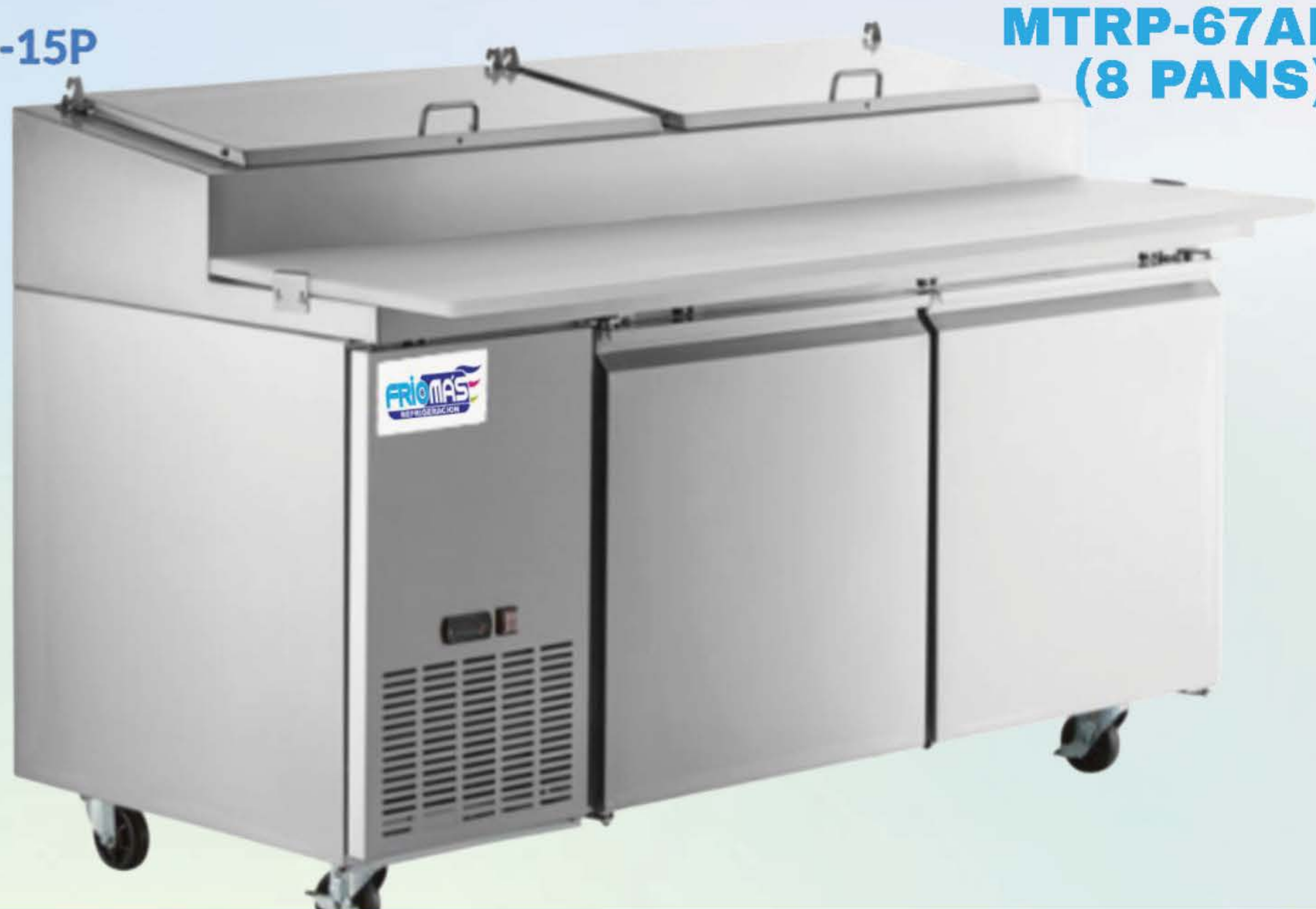
MTRP-67AI2P (8 PANS)