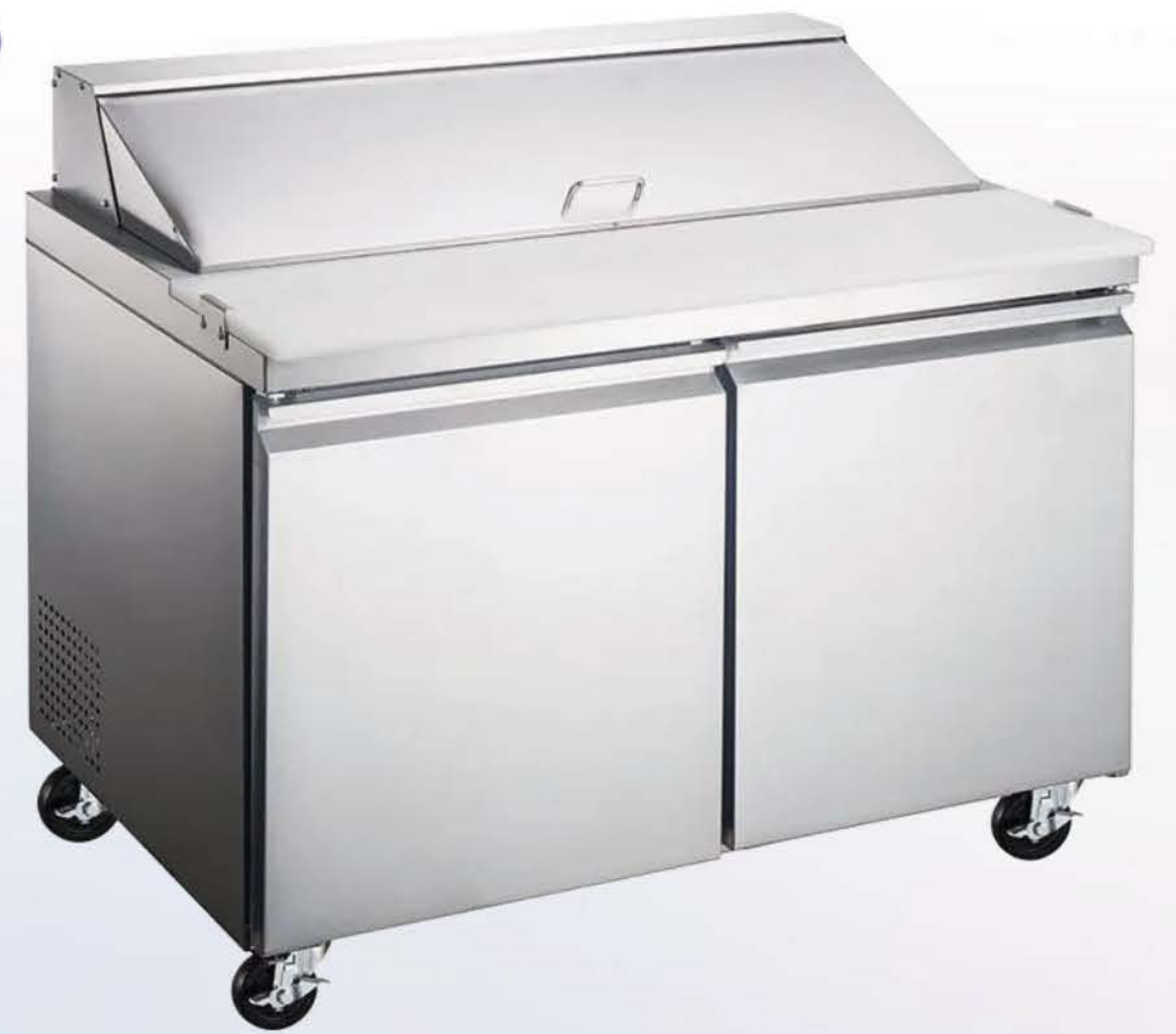
MTRS-48AI2P (12 Y 18 PANS)